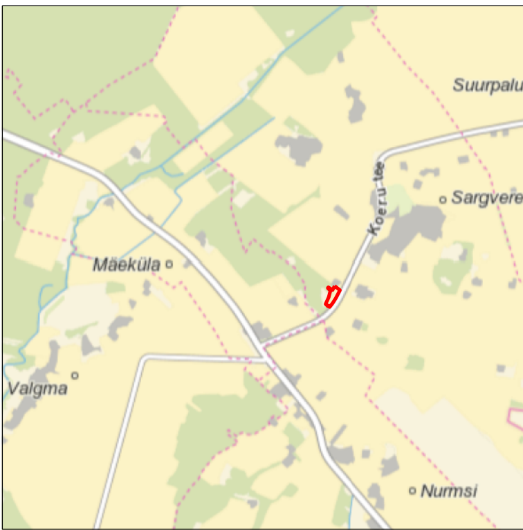
Kaardilehed nr 6324 Paide ja 6413 Järva-Jaani

Š-6 69,71 0,5 67,91 1,3 66,41 1,5 KA-1 0,2 66,84 0,4 VA-6 0,9 TL (Kr 10,2; ST 30,9)